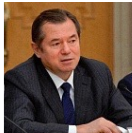
С.Ю. Глазьев Советник Президента Российской Федерации Председатель жюри конкурса «Менеджер года»