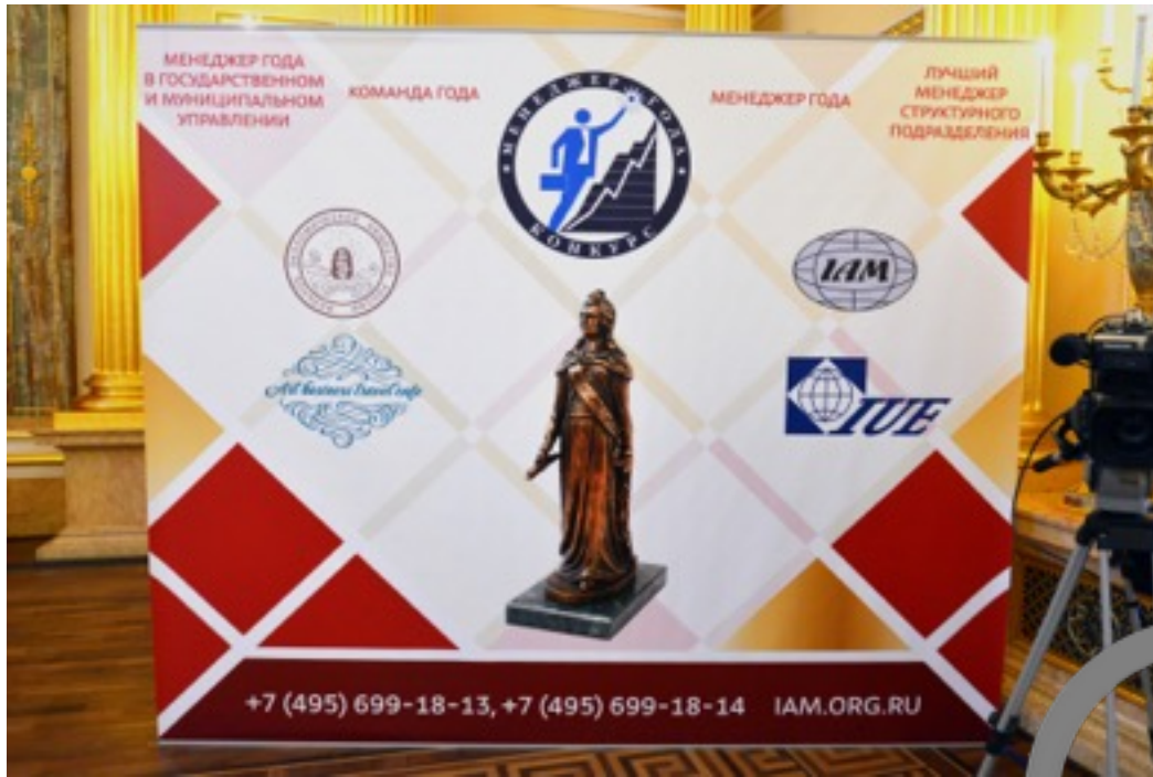
ФОТО ВИДЕО ОТЧЕТ - 2017