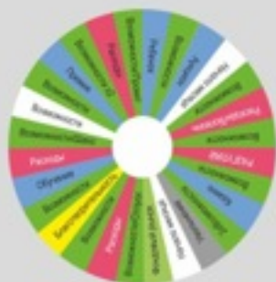
СХЕМА ПРИОБРЕТЕНИЯ ОПЫТА

Вам придется систематизировать личные финансы, формировать капитал, создавать активы, обрести финансовую независимость на пути к своей мечте.