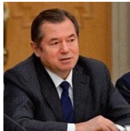
С.Ю. Глазьев Советник Президента Российской Федерации Председатель жюри конкурса «Менеджер года»